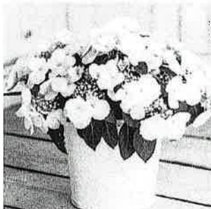
ラグランジア ブライダルシャワー

ブライダルシャワー……今までのあじさいの概念を覆す画期的品種。まず、葉の大きさが小さく蒸散量が少ないので乾きにくくあじさいの弱点を克服。またすべての側芽から花が咲くのでこれまでの6倍以上の花が咲くといわれています。剪定の必要もなくローメンテナンスでゴージャスなあじさいは2020年に発表されたばかりです。