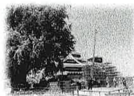
天守閣広場の 銀杏は健在！