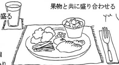
大きいプレートにサラダの小皿を 直接のせて。